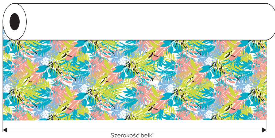
Pojedynczy moduł wzoru (raport)

Plik z grafiką przeznaczoną na poduszkę przygotowano bez linii cięcia uwzględniając spady. Dla usprawnienia krojenia można dodać niewielkie znaczniki. W zależności od wielkości poduszek ich układ w pliku może się zmienić. Zawsze jednak należy brać pod uwagę szerokość belki przygotowując plik i układ elementów.